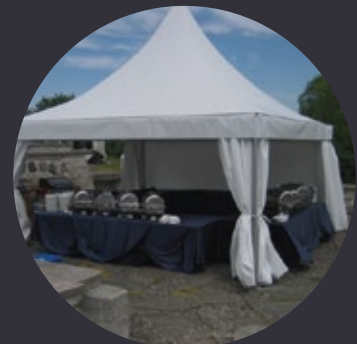
Kõrge tipuga Pagoda telk